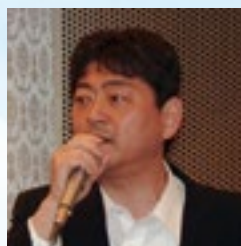
横原情報産業振興室長 挨拶