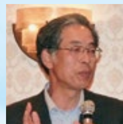
多久和顧問 退任挨拶