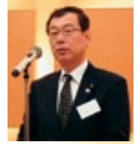
乾杯挨拶 西山部長