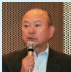
石碓副会長 主催者挨拶