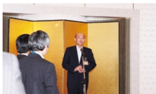
室崎島根県商工労働部次長