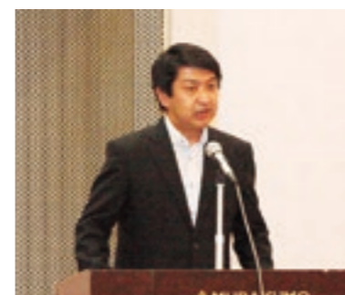
小島中国経済産業局地域経済部長祝辞

れ、地域発の言語Ruby普及のための施策を国として行っていること、ITが地域産業振興のけん引役となるよう支援するとの挨拶がありました。