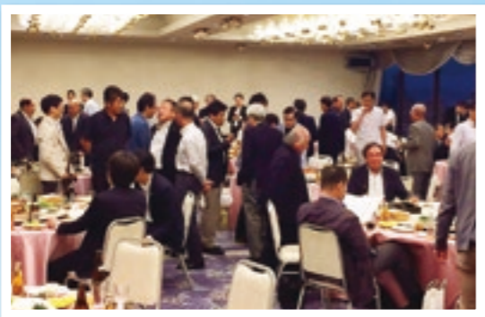
賑やかな懇親会の様子