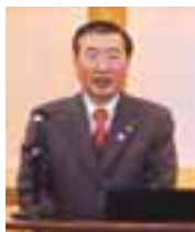
松浦正敬松江市長