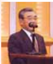
溝口善兵衛 島根県知事