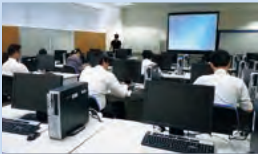
研修会の様子（プロジェクトマネジメントの技法）

当協会では、昨年引き続き島根県の「しまねIT産業育成支援事業補助金」交付を受け、4月から研修会を実施いたしました。