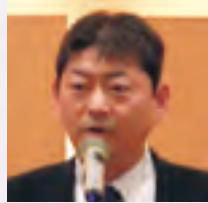
《来賓ご祝辞》 榎原室長