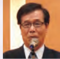
《乾杯ご発声》 広野副理事長