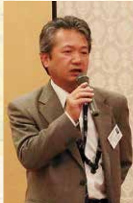
金山松江高専教授挨拶