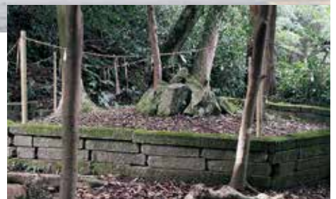
境内社 母儀人基社 はまのひともと