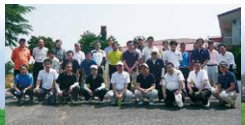
当日ご参加頂いた皆様